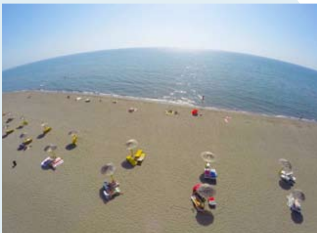
La plage du centre, vue d'en haut

zone du centre, excepté dans le bâtiment principal où se trouvent la réception et le restaurant et dans la zone marquée spécifiquement. Et il y a un autre restaurant au milieu de la plage naturiste où l'on peut être nu tout le temps.