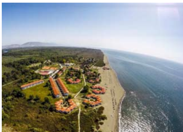
L'île d'Ada Bojana aujourd'hui et l'emplacement du centre de vacances

Un de ces endroits était certainement Ada Bojan. Ceci est une île (le mot Ada signifie île en turque), située au sud de l'État de Monténégro, à environ 20 km de la ville la plus proche. L'île a été créée par le delta de la rivière Bojana. Elle fut formée par le remblayage de sable de la rivière, autour d'un navire coulé à l'embouchure de la rivière Bojana.