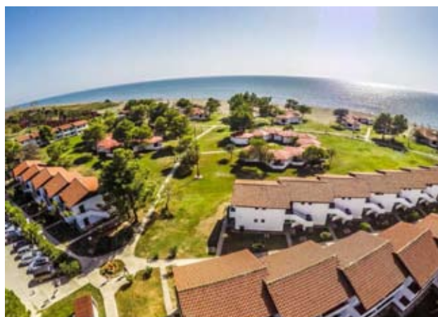
Gros plan du centre, vu d'en haut

Les premiers naturalistes arrivaient ici en 1972, hébergés dans 83 maisons à quatre appartements, avec une excellente vue sur la mer. Toute cette région faisait partie jadis de la Yougoslavie, un état fort avec une renommée internationale importante, ce qui apportait des temps d'or pour ce centre – qui