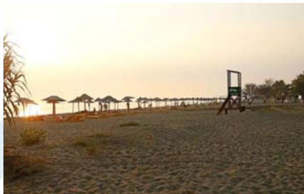
La plage du centre

Auteurs : Justimir Pavlović & Katarina Ristić, membres de l'Organisation Naturiste Serbe (NOS) http://www.nos.org.rs