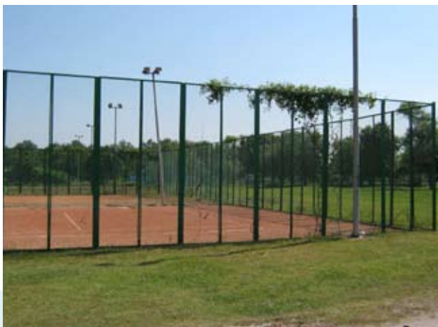
Le court de tennis dans le centre de vacances