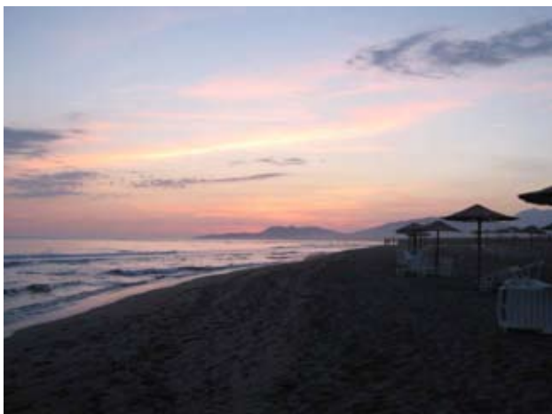
La légende dit qu'il y a un merveilleux coucher de soleil sur terre

La plage naturiste du centre a maintenant une longueur de 2 km, elle est propre, avec des douches et des chaises longues. On peut être nu dans toute la