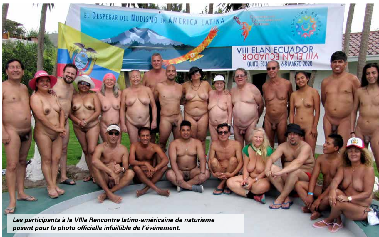
Les participants à la VIIIe Rencontre latino-américaine de naturisme posent pour la photo officielle infaillible de l'événement.

C'est avec la mission d'éveiller et de développer le naturisme en Amérique latine que s'est ouvert le 6 mars 2020, à Quito, capitale de l'Équateur, la huitième édition du Rencontre Latino-Américaine de Naturisme (VIII ELAN).