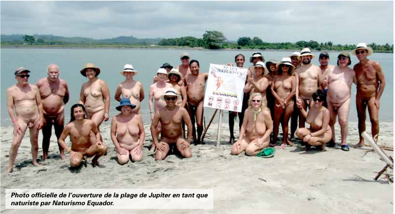
Photo officielle de l'ouverture de la plage de Jupiter en tant que naturiste par Naturismo Equador.

Une bonne partie des participants s'est rendue à Mompeche, sur la côte du pays pour un autre événement important, l'inauguration de la première plage officielle nudiste, située sur l'île Jupiter, célébrée avec un pique-nique et du vin rouge.