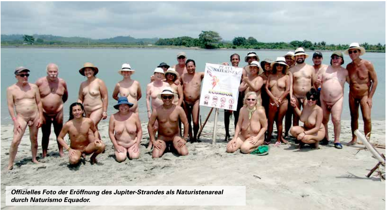
Offizielles Foto der Eröffnung des Jupiter-Strandes als Naturistenareal durch Naturismo Equador.

Ein großer Teil der Teilnehmer reiste weiter nach Mompeche an der Küste des Landes, um ein weiteres wichtiges Ereignis zu feiern, die Einweihung des ersten offiziellen FKK-Strandes auf der Insel Jupiter, die mit einem Picknick und Rotwein gefeiert wurde.