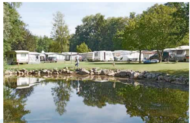
Der TCS-Campingplatz in Gampelen BE am Neuenburgersee mitten im Naturschutzgebiet Fanel.