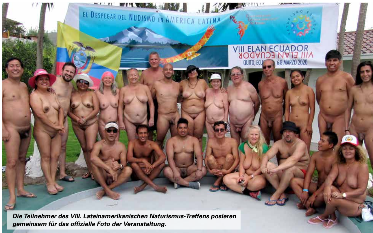
Die Teilnehmer des VIII. Lateinamerikanischen Naturismus-Treffens posieren gemeinsam für das offizielle Foto der Veranstaltung.

Mit der Mission, den Naturismus in Lateinamerika zu erwecken und zu entwickeln, wurde am 6. März 2020 in Quito, der Hauptstadt Ecuadors, zum 8. Mal das lateinamerikanische Naturismus-Treffen (VIII ELAN) eröffnet.