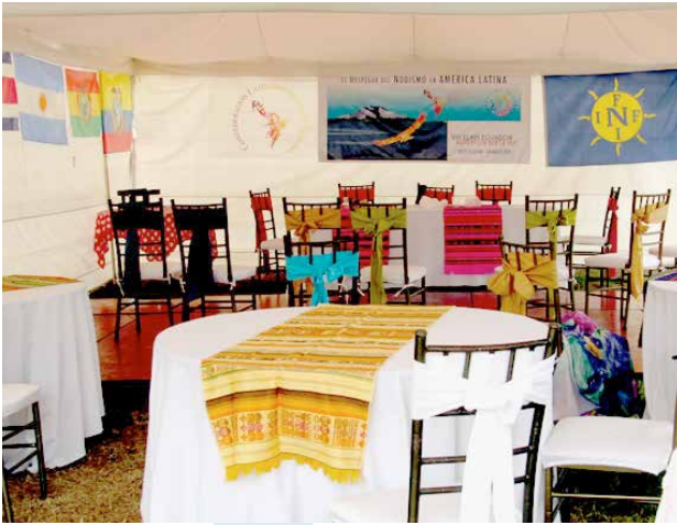
▲ Ein großes Zelt wurde aufgebaut und mit den Flaggen der teilnehmenden Länder und den für Ecuador typischen Farben dekoriert.

Das Frühstück wird im offiziellen Hostel der Veranstaltung, dem Hostal La Cocina Típica, direkt vor der Quinta serviert. In den bescheidenen aber komfortablen Einrichtungen des Gasthauses konnten wir jedoch keinen Naturismus praktizieren.